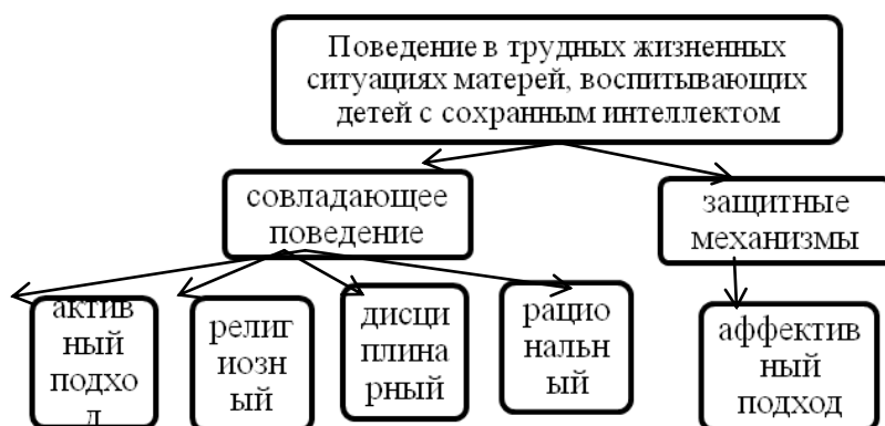
Рисунок 2. Результаты факторного анализа данных матерей, имеющих детей с сохранным интеллектом

Результаты факторного анализа показали, что матери детей с интеллектуальными нарушениями чаще используют защитные механизмы как способ реагирования на трудности («тревожный», «нетрадиционный», «отрицающий» подходы), тогда как совладающее поведение представлено у них значительно меньше («активный», «религиозный» подходы).