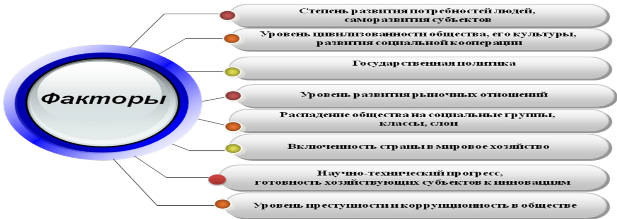
Рисунок 2 – Факторы, влияющие на условия хозяйствования и сбалансированность механизмов реализации экономических интересов