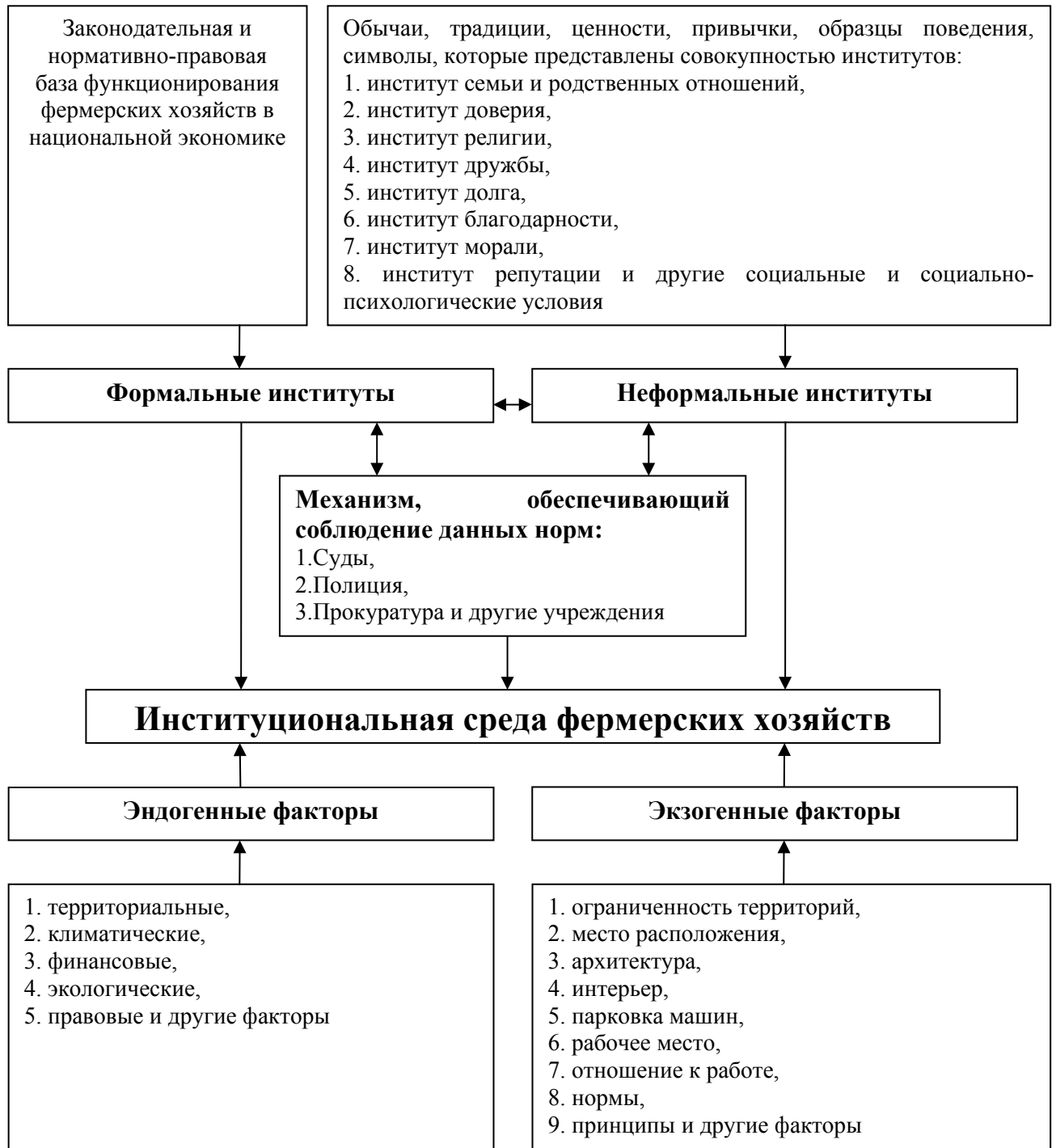
Рисунок 1. Институциональная среда фермерских хозяйств

Предложенное определение отражает основные особенности институциональной среды фермерских хозяйств, вытекающие из их экономической сущности, и, в отличие от других определений, является менее абстрактным, подчеркивая отличительные характеристики именно институциональной среды фермерских хозяйств: зависимость от конъюнктуры национального рынка, более сложную субъектную структуру, высокую социально-экономическую значимость, детерминирующую необходимость государственного регулирования.